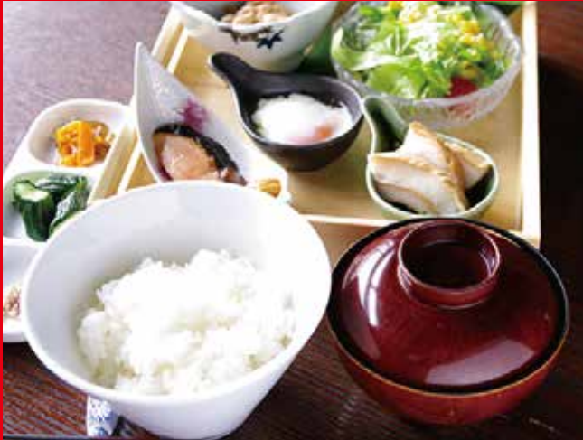
魚沼の朝ごはん定食