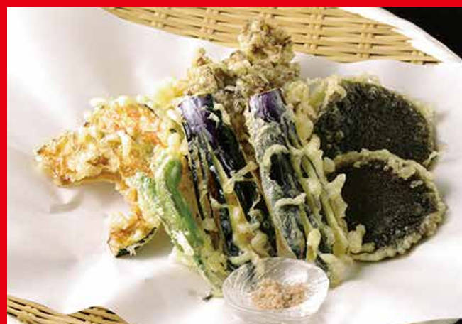
季節野菜の天ぷら