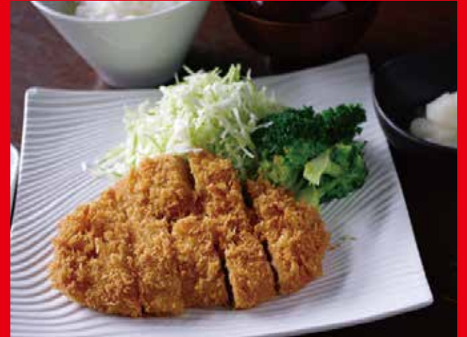
越後もちぶたのおろしかつ

Japanese Local Side Dish and Cold Miso Soup 1,080 円 (税別)