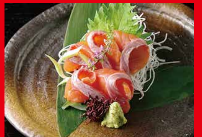
美雪ますのお造り