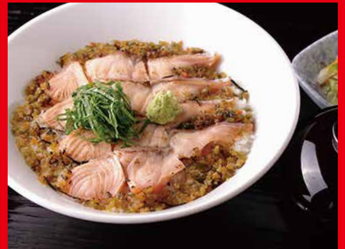
美雪ますの炙り丼

Lightly Broiled Miyuki Trout Rice Bowl 1,500 円 (税別)